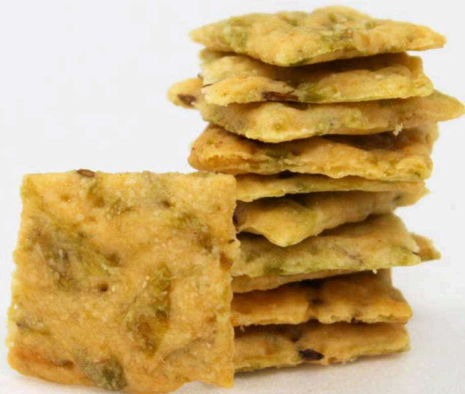
アーサとクミンのクラッカー