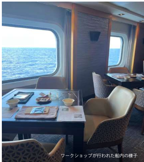
ワークショップが行われた船内の様子

9月、伊是名島のアクセサリーショップ「island jewelry ele (アイランドジュエリー・エレ)」が、那覇発・佐世保韓国行きのクルーズ船で夜光貝のネックレスづくりワークショップを開催しました。