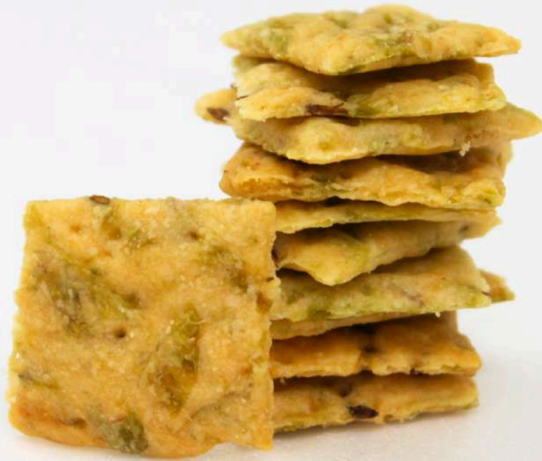
アーサとクミンのクラッカー